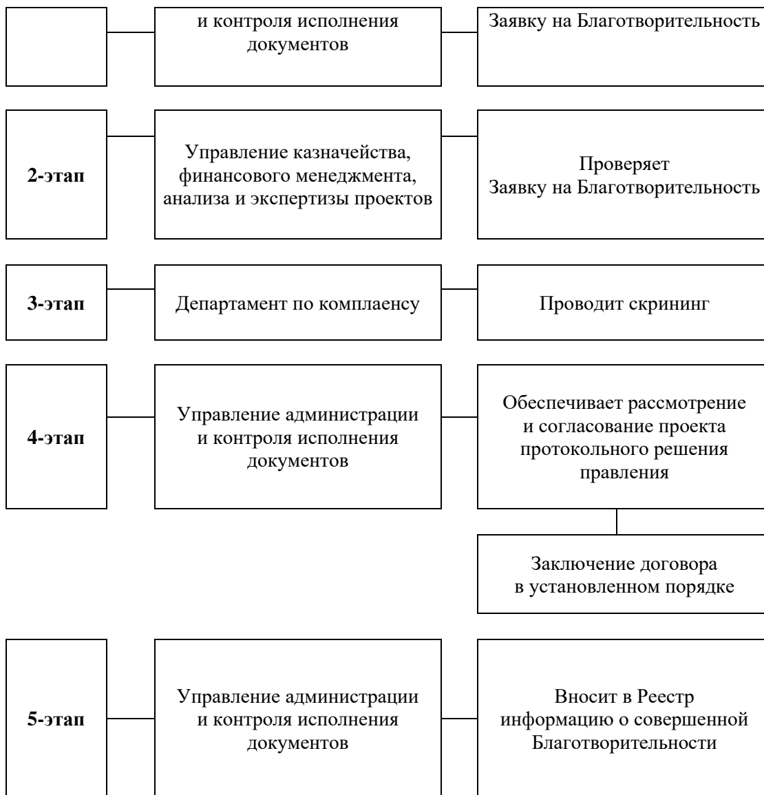
СХЕМА процедуры по Коммерческому спонсорству