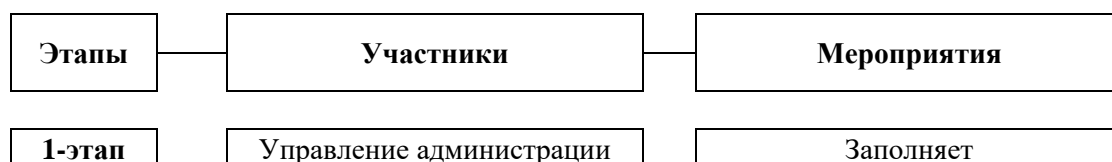
СХЕМА процедуры по Благотворительности

Приложение №1 к Политике по благотворительности и коммерческому спонсорству СП АО «Уз-Донг Вон ко»